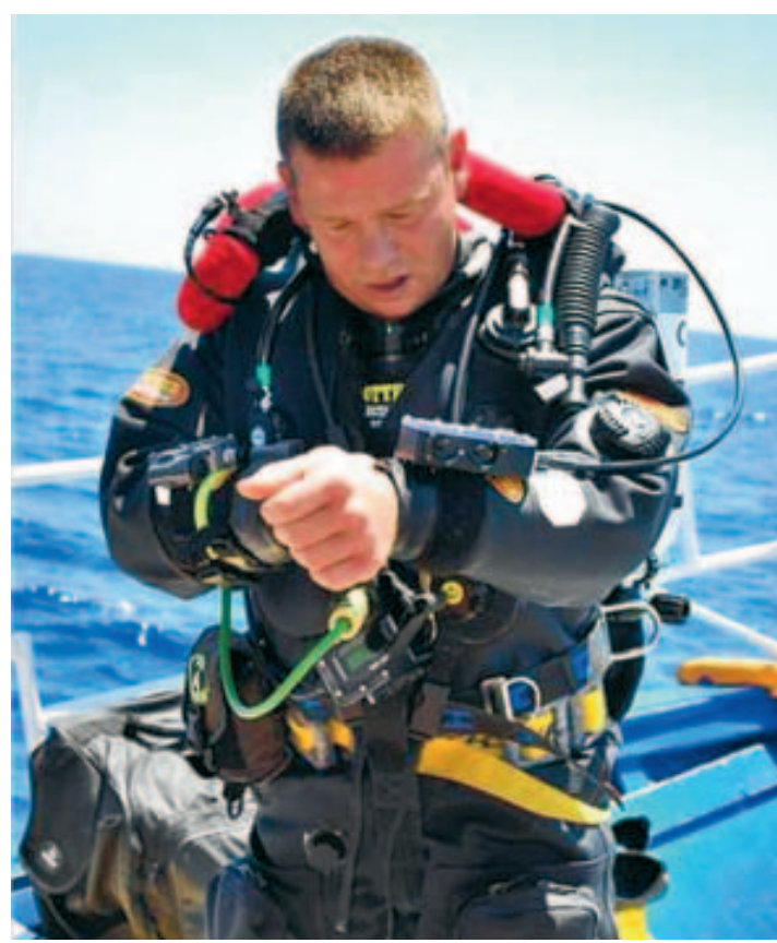
La plongée est un sport exigeant.

Mais pour aller explorer les épaves de navires tels que le Manchester, d'autres brevets de plongée plus techniques sont nécessaires. "Il existe deux types de plongée: la plongée de loisir et la plongée technique. Alors que dans la plongée de loisir, on s'immerge équipé seulement d'un gilet et d'une bouteille, la plongée technique, qui est plus longue et plus pro-