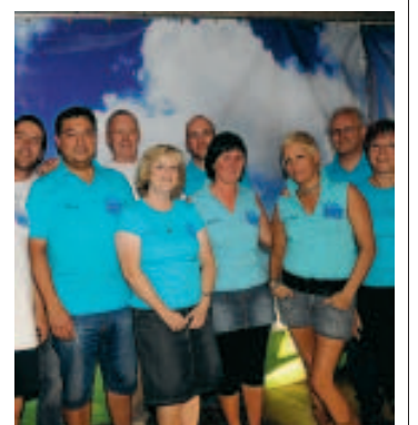
Le comité organisateur. ■ E.G.

Dès ce soir, Erbisoeul entame son grand week-end de fête. Au programme: aujourd'hui à partir de 18H30, concours de manille. Demain, à partir de 15H: nombreuses animations pour petits et grands et soirée années 80 (entrée: 5€)! Dimanche dès 8H du matin: petit déjeuner, à 10H rallye d'ancêtres et inscriptions pour la balade à moto, à 11H30: concert-apéritif. L'après-midi, jeux à l'ancienne pour les enfants et nombreuses animations pour toute la famille. Durant les 3 jours, bar et petite restauration. Plus d'infos au 0478/28.63.44. «