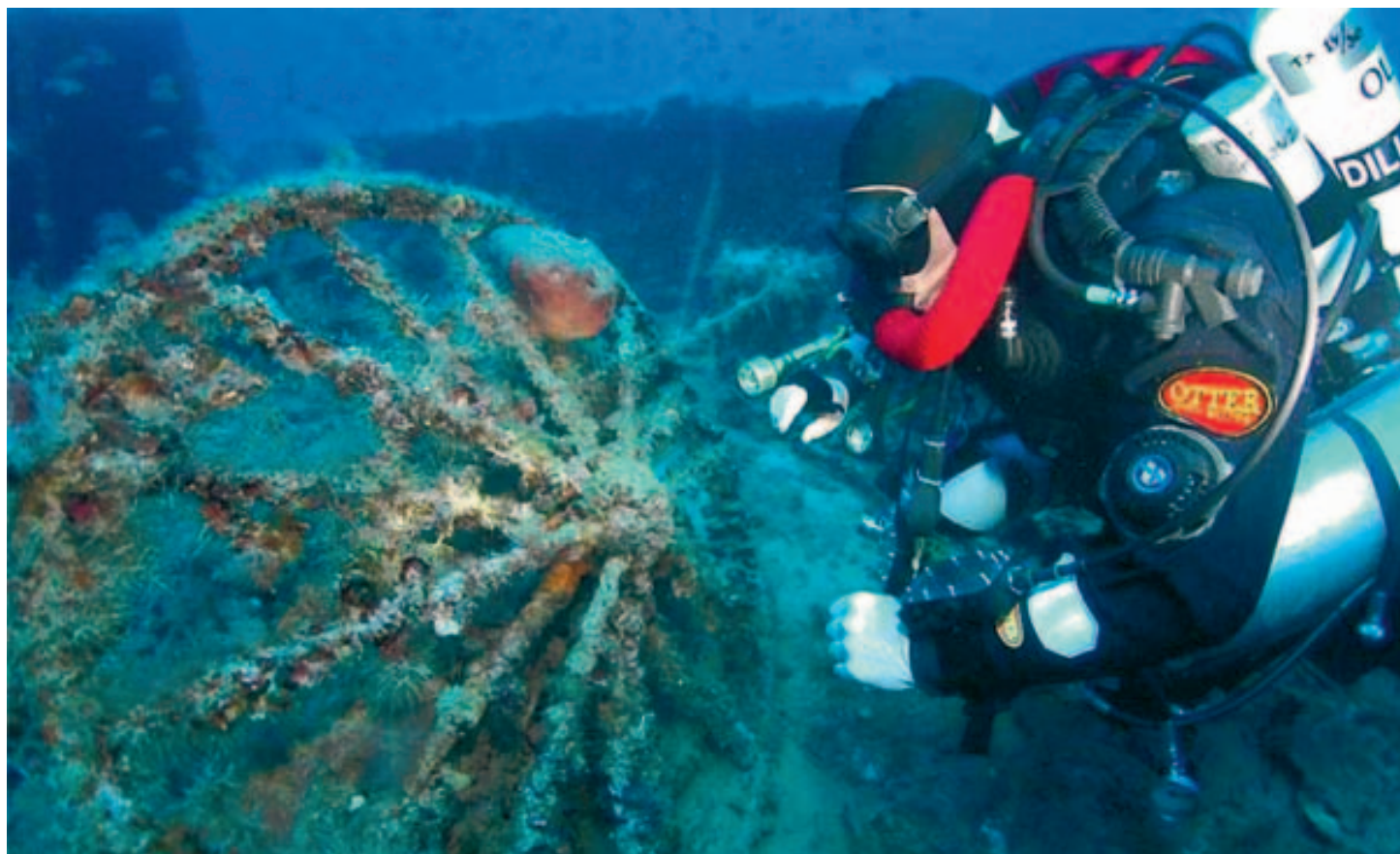
Les navires de guerre de l'Opération Pedestal gisent par le fond depuis soixante-sept ans.

Le navire militaire, en dépit de son grand âge, n'a rien perdu de sa superbe. "Par chance, le capitaine de notre bateau avait lancé la corde tout près d'une tourelle avant. J'ai pu m'y introduire ainsi que dans la capitainerie. Mais il fallait faire très attention de ne pas rester coincé, certains plongeurs trop imprudents sont restés en bas!" Les hommes n'ont pu rester